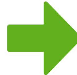
Nationellt riktvärde fast läkarkontakt