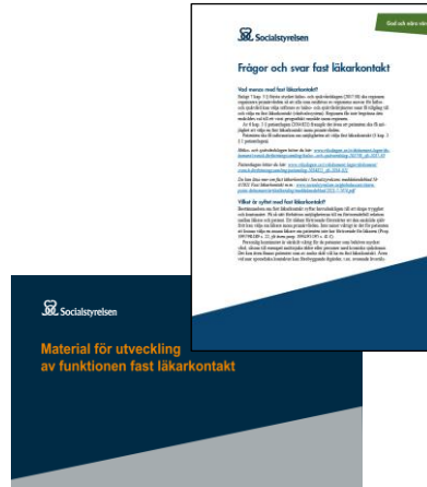
Material för arbetsplatsträffar samt Frågor och svar