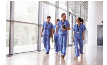
Beskrivning kompetens fast läkarkontakt