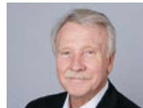
Ilmar Reepalu (S)* Delegationsordförande Malmö stad