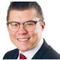
Joakim Larsson (MP)* Västra Götalands- regionen

Utskottet för miljö, klimatförändringar och energi. Aktuella frågor under hösten är bland annat energunionen och Parisprotokollet.