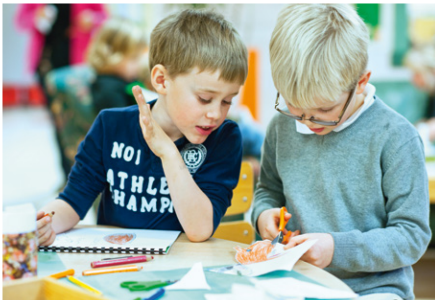
Fritidshemmet bidrar till att eleverna utvecklar kreativitet.

Fritidshemmet kan utmana elevernas lärande utan prestationskrav. Arbetsformerna och lärmiljön gör att elever kan ta till sig kunskaper på ett annat sätt än i skolan och förskoleklassen. En mer utforskande, elevinitierad, laborativ och praktisk metodik kan bidra till högre måluppfyllelse. Elever som lyckas i en mer informell lärsituation kan få stärkt självkänsla och självförtroende, något som i sin tur kan förbättra lärandet i de mer formella situationerna i skolan.