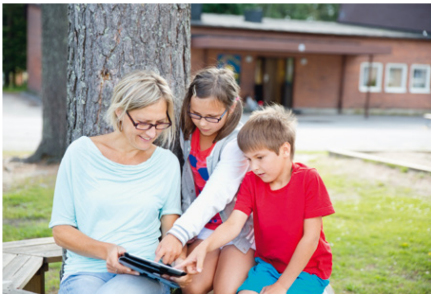
Både lärare och elever ska vara delaktiga i det systematiska kvalitetsarbetet.

En betydelsefull grund för samverkan är att lärarna i förskoleklassen, skolan och fritidshemmet har kunskap om varandras uppdrag och arbetssätt. SKL anser att detta bidrar till att skapa en helhetssyn på elevernas lärande och utveckling samt insikt om hur de olika kompetenserna och verksamheterna kompletterar varandra.