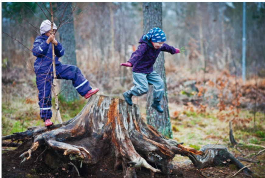
En god utemiljö stimulerar till lek och rörelse.