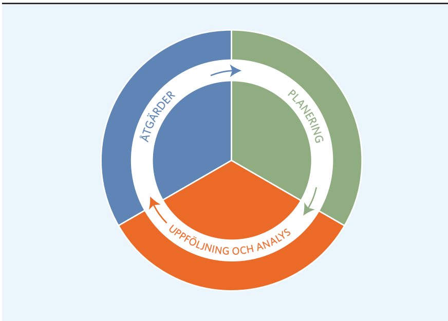
FIGUR 1. Kvalitetshjulet illustrerar det systematiska kvalitetsarbetet

Kvalitetsarbetet ska enligt skollagen genomföras på varje fritidshem och samtidigt vara en del av skolans och huvudmannens samlade kvalitetsarbete. Det systematiska kvalitetsarbetet ska utgå från en helhetssyn på elevens lärande och hela den dag då eleven vistas i skolan så att barnets behov av lek, vila och fritid tillgodoses. I avsnittet om processkvalitet behandlas det systematiska kvalitetsarbetet på den enskilda enheten.